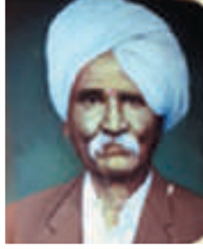
कै. रामचंद्र लक्ष्मण फाळके